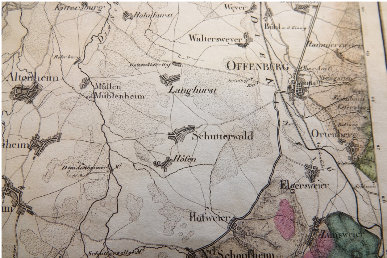
Topographische Charte von Schwaben, zur Verfügung gestellt von der Bibliothek des Historischen Vereins von Mittelbaden, Kork.