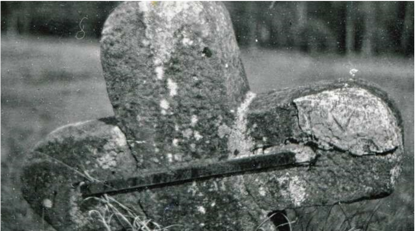
Das Franzosenkreuz im »Glückshäfele« - warum steht es da?

Beitrag im Offenburger Tageblatt von Clemens Herrmann 7. März 2019